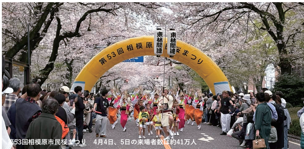
第53回相模原市民桜まつり 4月4日、5日の来場者数は約41万人

土木職、建築職等、必要な人材の確保に苦慮しています。市民の暮らしに直結する深刻な人手不足にどう対処していくのか。市政の優先順位が問われています。今、必要なのはハコモノ建設より人への投資ではないでしょうか（P・2参照）。